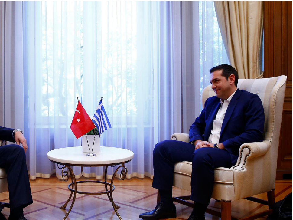
داما زراو. بەلام ئیمە تراکییه سەرموفتییهك دەگرێتەوه؟ لە رۆژئاواى تراکییه سەرموفتییهك دامازراو. بەلام ئیمە

"بەلێ بەرپێر چىپراس دەلێت ۴۳ ساڵە بەم جۆرە بەردەوام بوو، منیش بە گۆرەى ئەوەى تەمەنم ۶۳ ساڵە و تا ئیستا ھەمان شتم بێنیو، ئیستاش ھەمان شت دەبینم. كەوايە دەبێت رینگەچارەى ك بەدۆزینەوه بۆ ئەم كیشەى. بەلام لە كاتی گەران بە دوای رینگەچارە، من خاوەن ئەزمونیكی باشم. ئەموو كاتیش لە نزیكەوه چاودێرى ماوەكەم كردوو. لەم ماوەیەدا، زۆر باش دەزانم كە كى لە بابەتەكە رايكردوو، دەتوانم ھەموو بەلگە و زانیارییهكان بەم بە ئیو."